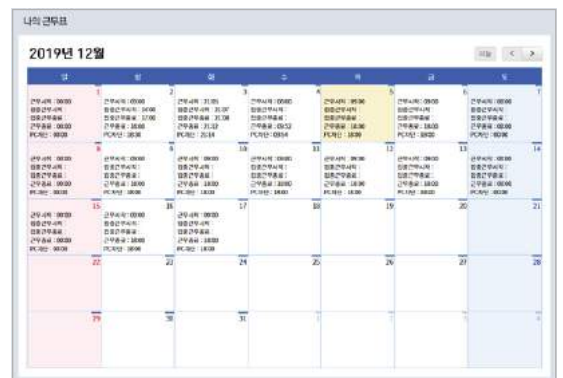
▲ 근무시간표(휴가 등/실제 근무이력)