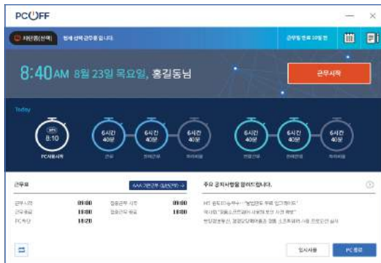
▲ 근무시간표 및 근무상태