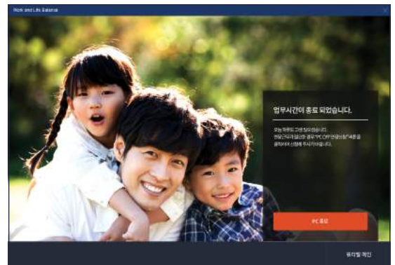
▲ 근무시작/종료 알림