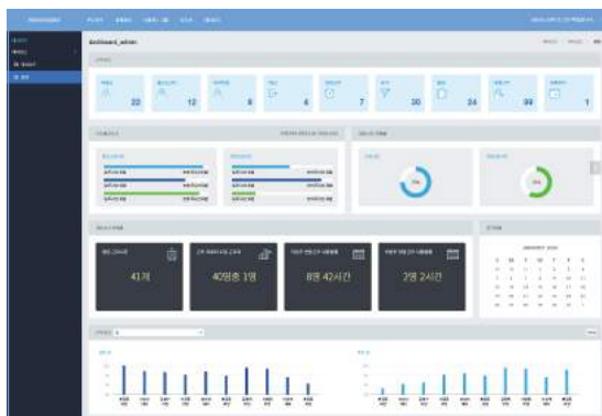
▲ 부서별 근무상태 및 PC-OFF 현황